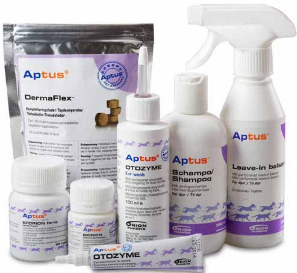
Produkter som ingår i Aptus lila serie.