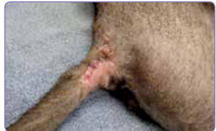
16 dagar efter påbörjad behandling kunde såret slutas helt.