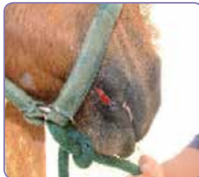
Användning av EquitrX Gel dag 4

"Jag påbörjade behandling med EquitrX och sårskadan var nästan helt läkt efter 4 dagar. Det har nu gått ungefär en månad och endast minimal ärrbildning som syns enbart om man tittar nära."