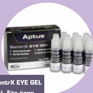
Aptus® SentrX EYE GEL 10 x 3 ml. För ögon.

Följande SentrX produkter är tillgängliga på den svenska marknaden