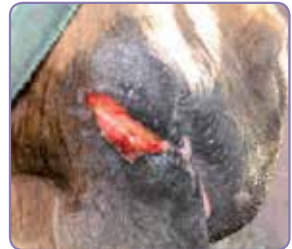
Abscessen behandlad och användning av EquitrX Gel dag 1 inledd