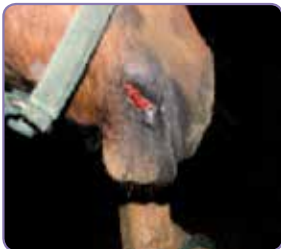
Användning av EquitrX Gel dag 2