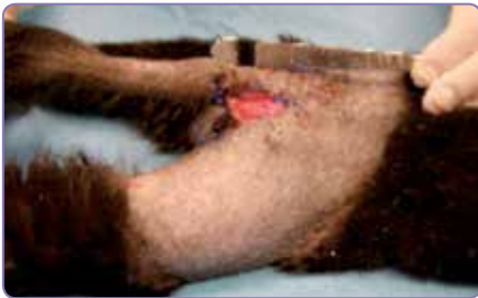
Efter 9 dagar påbörjades den kirurgiska slutningen av såret.