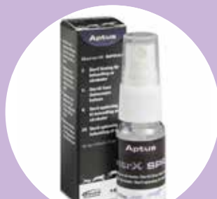
Aptus® SentrX SPRAY 15 ml. För sårläkning.