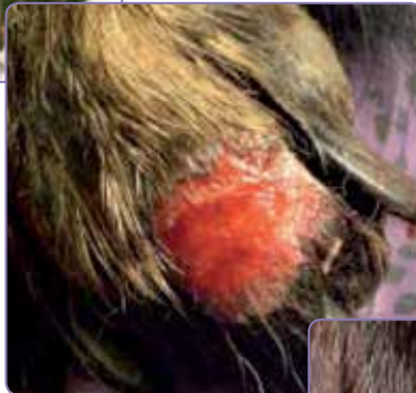
Två veckor efter ingreppet är läkningsprocessen god.