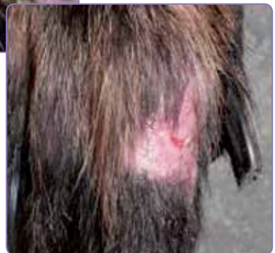
Tassen dygt en månad efter operation.

Notera: CanitrX gel marknadsförs i Sverige under namnet Aptus® SentrX spray.