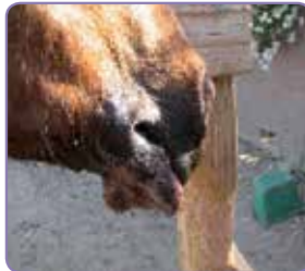
Efter första behandlingen