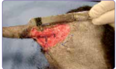
Efter 4 dagars behandling.