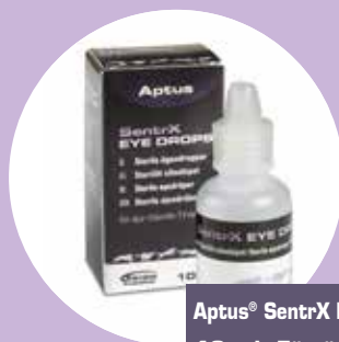
Aptus® SentrX EYE DROPS 10 ml. För ögon.